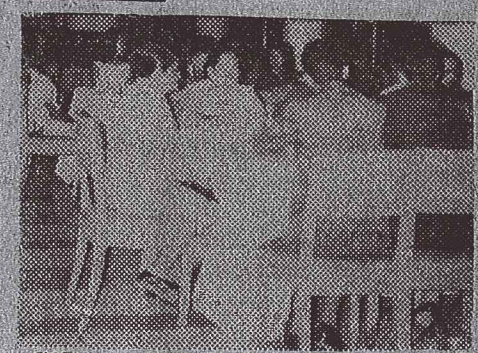
CALI. — Parte de los asistentes a una de las reuniones con profesionales efectuada en el salón "A. Aristizábal" del Hotel Aristi.